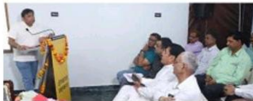
कार्यक्रम में शामिल अतिथि व संस्थान के सदस्य।

चिरायु योजना है। जिन लोगों की सालाना आय 3 लाख तक है वो भी